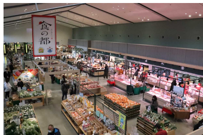
KADODE OOIGAWA マルシェ

静岡県内最大規模のマルシェや緑茶体験、農家レストランDa Monde（ダ・モンデ）など飲食物販施設16店舗、キッズパーク「ちゃめつけ」、TOURIST INFORMATION「おおいなび」、イベント広場、C11-312が復元展示されたSL広場、ドッグラン、駐車場（約550台）などからなる体験型フードパークです。16種のオリジナル緑茶MANDARA GREEN TEA等のKADODE OOIGAWA限定商品や静岡県内の土産物を多数取り扱います。