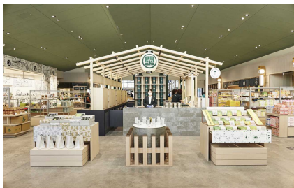
大井川流域のお茶や県内の土産物を販売するお茶エリア